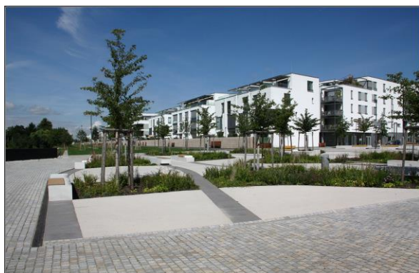
Blick in die Bahnstadt